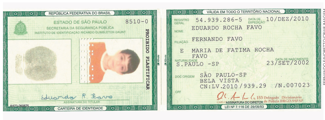
Carteira de Identidade de um menino.

Individualidade: o que diferencia um indivíduo de outros.